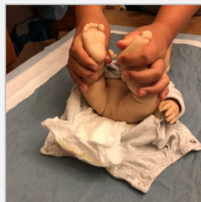
Figura 1: Poner al niño con las piernas dobladas y las rodillas hacia afuera, de manera similar a la posición usada para cambiarle el pañal. Sostenerle los pies y talones con una mano y apoyarlos sobre su estómago, de manera de poder tener una buena visión del ano.

Figura 2: Aconsejamos que dos personas sean las que hagan la dilatación para evitar el riesgo de que el dilatador pueda causar algún daño en el ano del niño. Una persona puede sostener los pies del niño en la posición correcta, de manera que los muslos estén contra la pancita del niño y, a la vez, consolarlo o distraerlo. Comprobar de estar sosteniendo al niño de manera segura y firme.